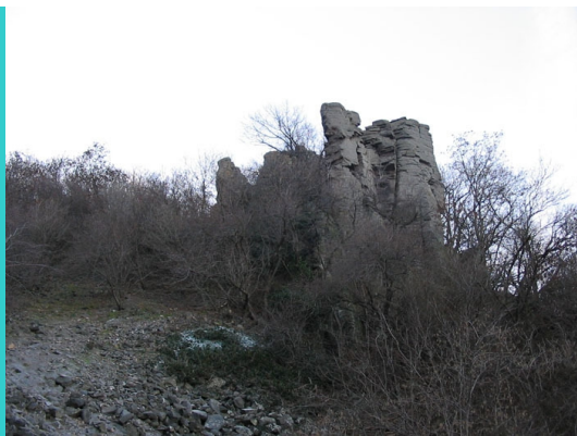
A hegyről lefelé elérhetjük a Kőkaput, Badacsony fontos természeti nevezetességét. Az oszlopok a szélfúvás, a víz oldó munkájának eredményeként jöttek létre. Olyanok, mint óriások egymásra rakott építőkövei