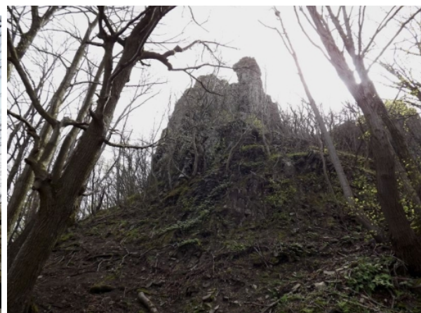
Elhagyott kőbányában emlékeztünk a munkaszolgálatosokról.