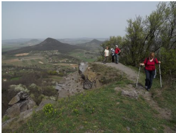
A hegyről a Kőkapunál ereszkedtünk lefelé.